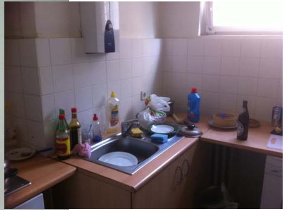
安装厨房设备后的厨房