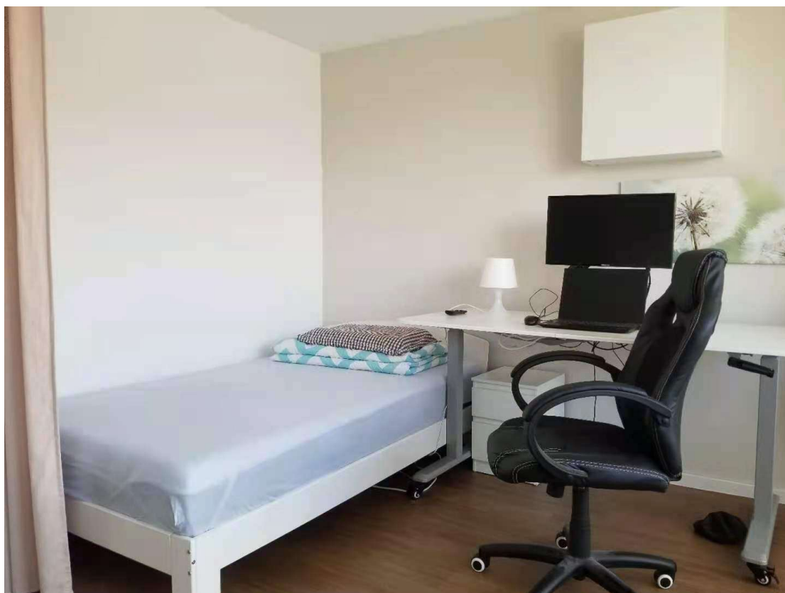
床 1.2 米 X 2.0 米及床上用品，可升降办公桌，高背靠椅。