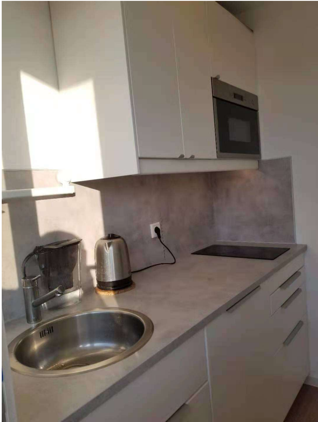
自来水过滤壶，电热水壶