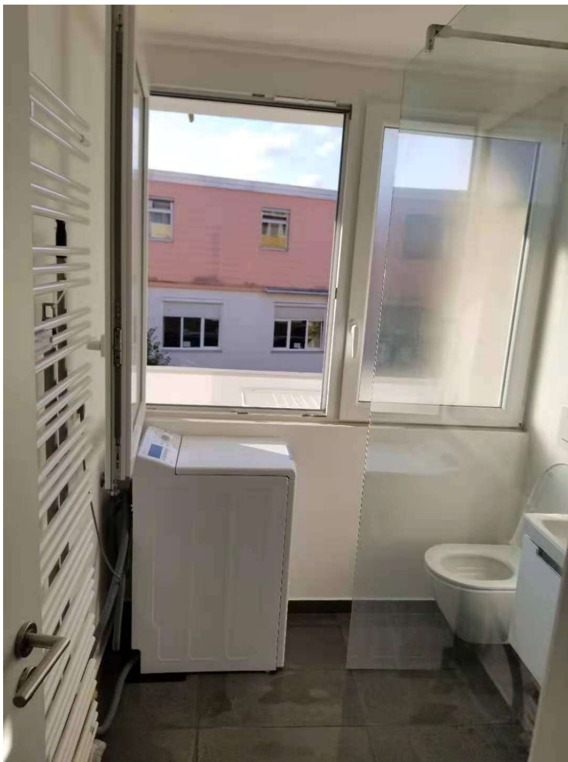
全自动滚筒洗衣机