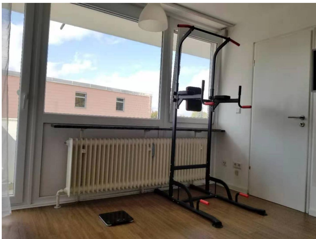
运动健身器材，电子体重秤