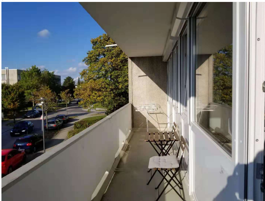
室外观景桌椅，晾衣架